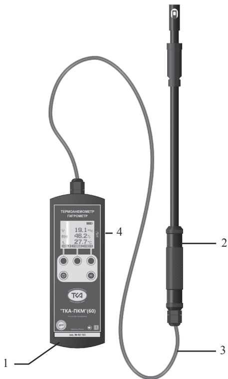
Рис.1. Внешний вид прибора “TKA-ПКМ”(60)