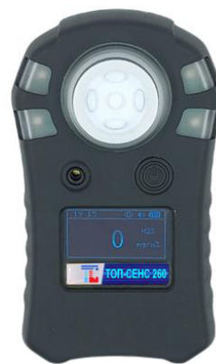
б) модификация ТОП-СЕНС 260