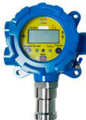
м) модификации ТОП-СЕНС 4100 S