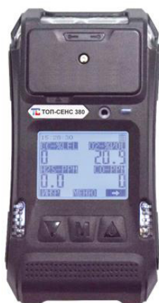
д) модификация ТОП-СЕНС 380