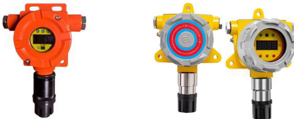
н) модификация ТОП-СЕНС 10 N