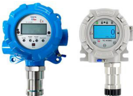
л) модификация ТОП-СЕНС 4100 G