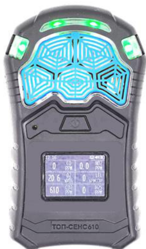
ж) модификация ТОП-СЕНС 610