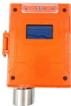
и) модификация ТОП-СЕНС 1000