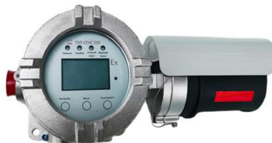
з) модификация ТОП-СЕНС 500