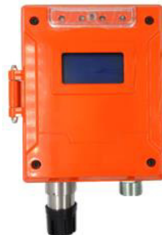
к) модификация ТОП-СЕНС F