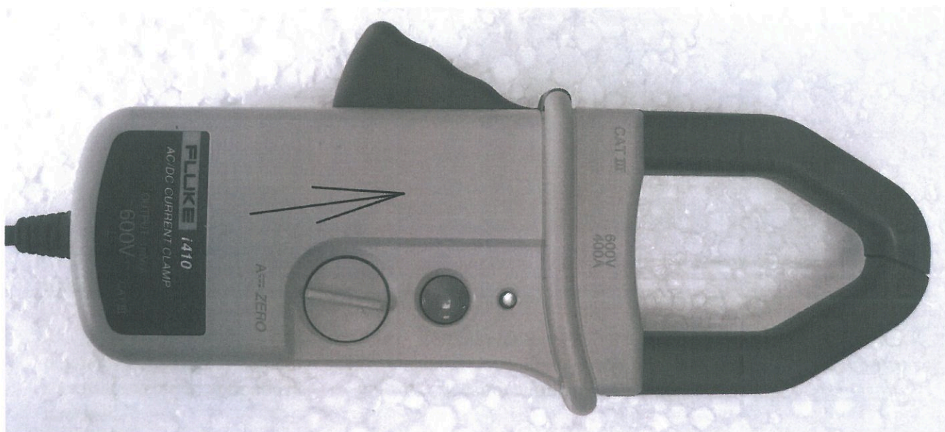
Рисунок 3 - Внешний вид клещей модели Fluke i410, стрелкой показано место нанесения знака утверждения типа