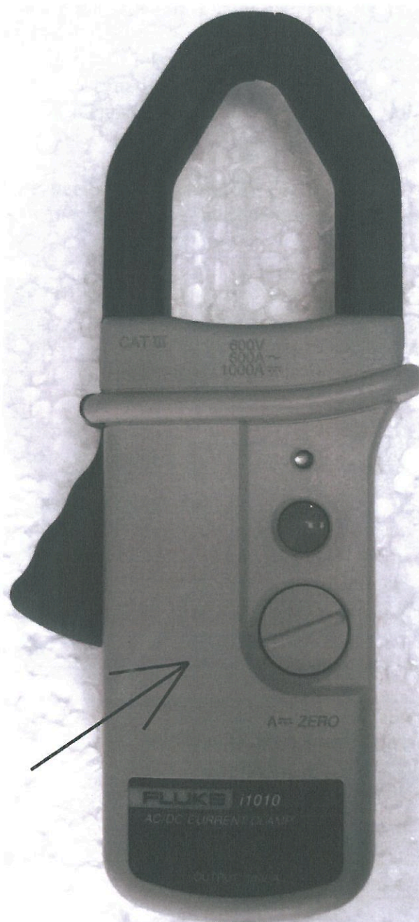
Рисунок 4 - Внешний вид клещей модели Fluke i1010, стрелкой показано место нанесения знака утверждения типа.

Клещи используются для подключения к измерительным устройствам, осуществляющим измерение электрического сигнала на выходе клещей и его дальнейшую математическую обработку с учётом установленного коэффициента преобразования клещей.