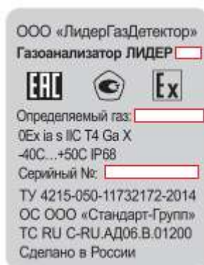
Рисунок 2 – Идентификационная табличка газоанализаторов

Защита от несанкционированного доступа к настройкам газоанализаторов осуществляется посредством введения секретного кода (пароля). Дополнительных мер защиты в виде пломб, наклеек не требуется.