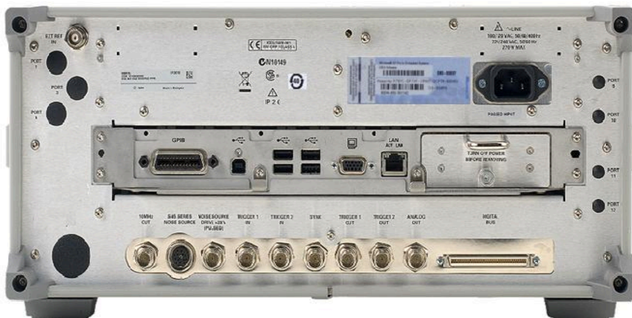
Места пломбирования от несанкционированного доступа