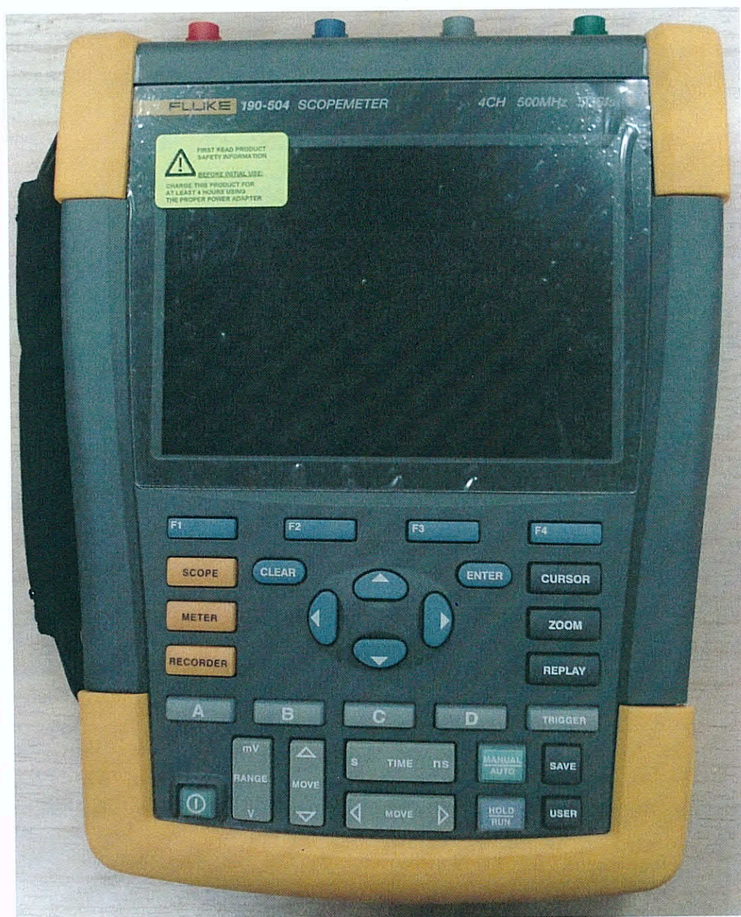
Рисунок 1 – Общий вид осциллографов Fluke 190. Вид спереди

Схема пломбировки от несанкционированного доступа представлена на рисунке 4.