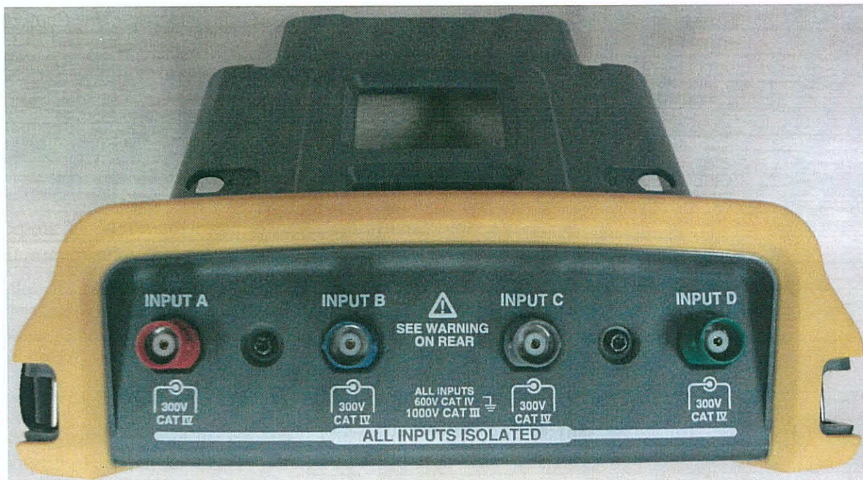
Рисунок 3 – Общий вид осциллографов Fluke 190. Вид с торца