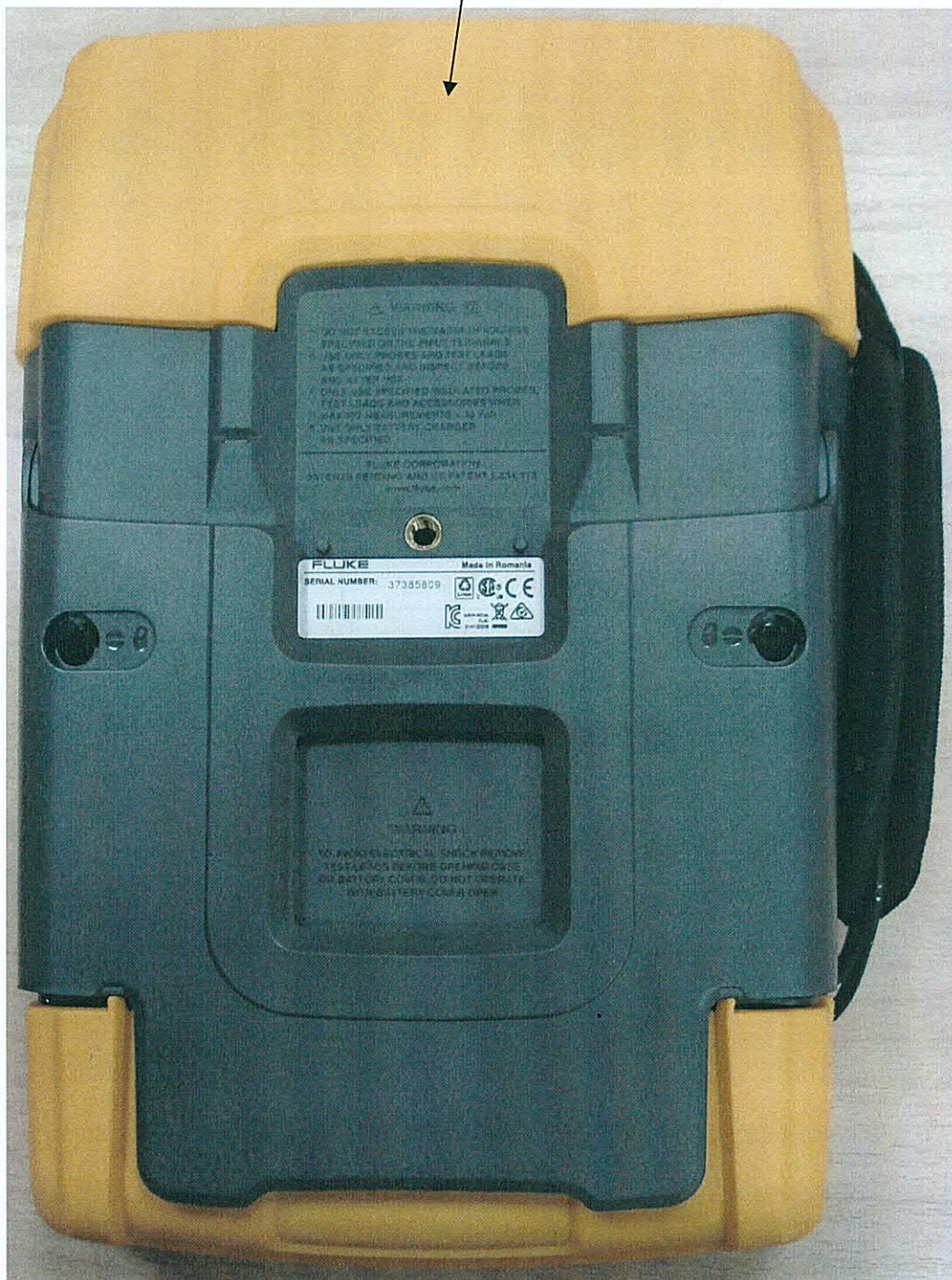
Рисунок 2 – Общий вид осциллографов Fluke 190. Вид сзади